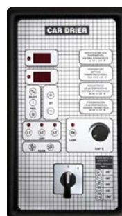
Tipo 3 Type 3