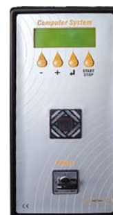
Tipo 5 Type 5