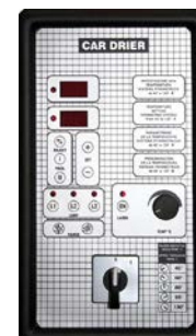
Tipo 3 Type 3