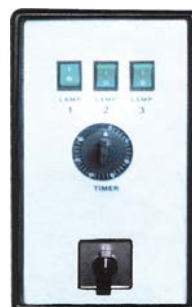
Tipo 1 Type 1