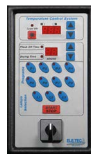
Tipo 4 Type 4