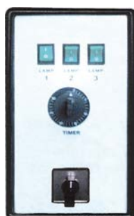
Tipo 1 Type 1